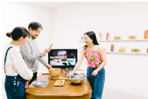
「Open Studio 2021 Autumn」 開催風景