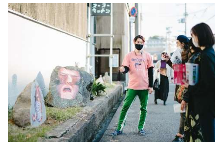
Open Studio 2021 Autumn スタジオツアー 開催風景

状況により、プログラム内容を変更または中止とする場合があります。最新情報は WEB サイトをご確認ください。